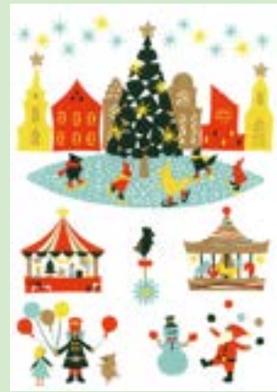
「クリスマスマーケット」(2020) (Hausgidaウォールステッカー原画)