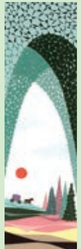
「洞窟アーチ」(2020) (竹尾ハナカレンター2022原画)