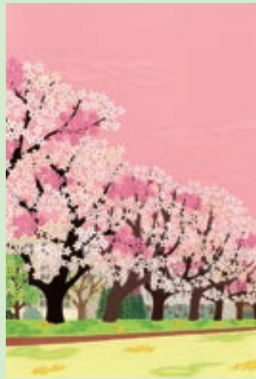
「桜並木とグラウンド」(2023)