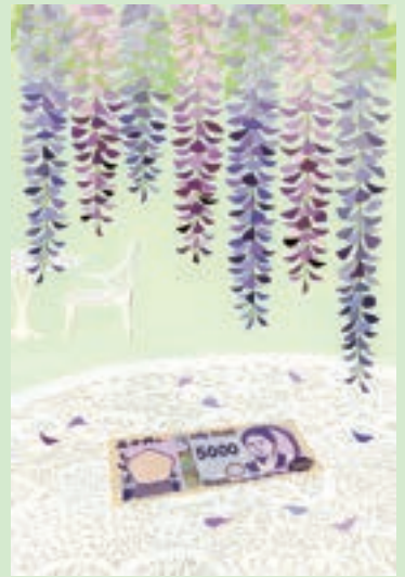
「新五千円札と中庭の藤」(2024)