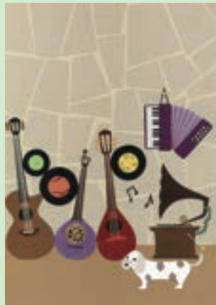
「Jam session-留守番中-」(2009) (『月刊公民館』表紙原画)