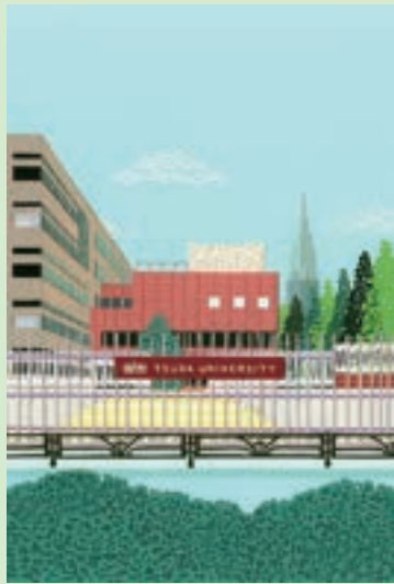
「青葉の千駄ヶ谷キャンパス」(2022)