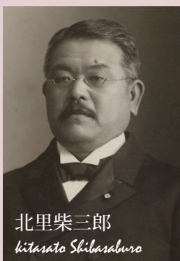
学校法人北里研究所 所蔵

女性の地位を高めるために自分自身の学校を作りたいと願う梅子は再度留学を決意。1889年、再渡米し、プリンマー大学で生物学を専攻。（その際に執筆した論文が英国の学術雑誌に掲載されたため、「欧米の学術雑誌に論文が掲載された最初の日本人女性」と言われている。）1892年に帰国。華族女学校、女子高等師範学校（現・お茶の水女子大学）で教鞭を執った後、1900年、女子英学塾を創設。生涯を通じて、女性の地位向上と女子高等教育に尽力しました。