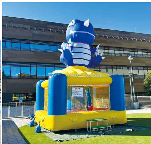
梅公園に設置したエアアスレチック