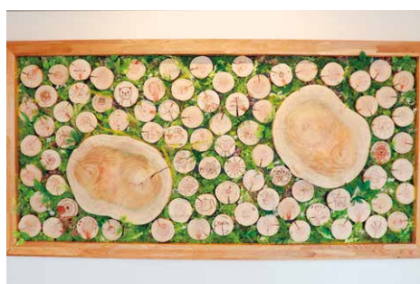
在学生・教職員によるアートワーク