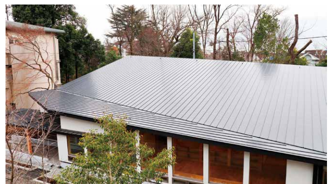
ウェルネス館外観