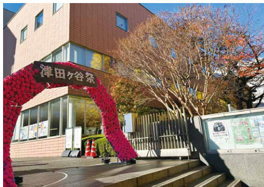
キャンパス入口のアーチ

第9回津田ヶ谷祭を盛会のうちに、無事終了することができました。今年度は「Link to_」というテーマのもと、地域・自治体・企業の皆さまとのつながりをより一層深めることを目標に掲げ、来場者の方々にとって親しみやすく、あたたかみのある大学祭を目指し、運営を行いました。幸いにも晴天に恵まれ、地域の皆さまをはじめ、在学生のご家族や卒業生など多くの方々にご足を運んでいただき、両日合わせて1700人を超える方にご来場いただきました。今年度は、津田ヶ谷祭で初めての試みとして、梅公園にエアアスレチックを設置しました。大学の外からも目を惹く設営となり、親子で楽しんでいる姿も多く見受けられました。また、構内では例年好評の謎解き企画を強化させました。謎解きの全問正解者が参加できるビンゴ大会を新たに開催し、予想よりもはるかに多くの方々にご参加いただきました。来場者アンケートでも満足度の高い企画となり、実際に「とても盛り上がっていた」「来年もビンゴ大会をやってほしい」という回答をいただきました。今後も、津田ヶ谷祭を通じて生まれた多くのご縁を大切にしながら、大学と地域とのつながりをより一層深めていきたいと存じます。あらためて、第9回津田ヶ谷祭の開催にあたり、ご協力を賜りましたすべての皆さまに心より感謝申し上げます。