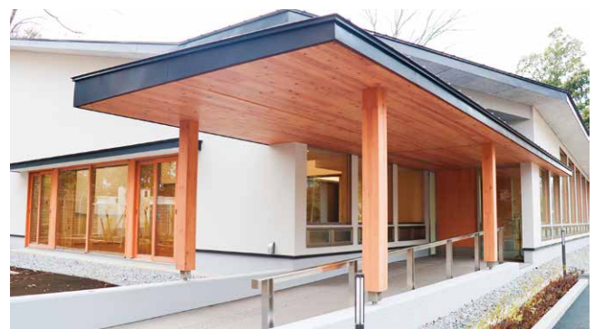
ウェルネス館入口

ウェルネス館は、人と人、人と自然をやさしくつなぎ、キャンパスに新たな安心と温もりをもたらす場所として、これからの大学生活を支えています。