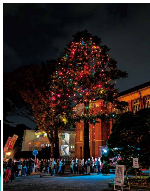
小平キャンパスにて