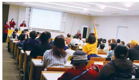
初開催のビンゴ大会