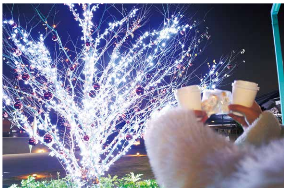
千駄ヶ谷キャンパスにて

協定の一員である「and C」様のご協力により、来場者へレモネードやフレーバーティーといったホットドリンクと、雪を思わせるスノーボールクッキーの提供も行われました。両キャンパスとも寒さの中にも温もりを感じられるイベントとなりました。ご協力くださった皆さまに心より御礼申し上げます。